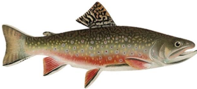
Omble chevalier ( Salvelinus alpinus oquassa )